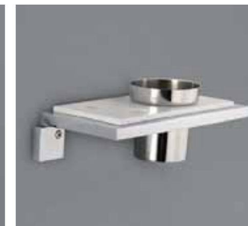
portabicchiere Art. 8321