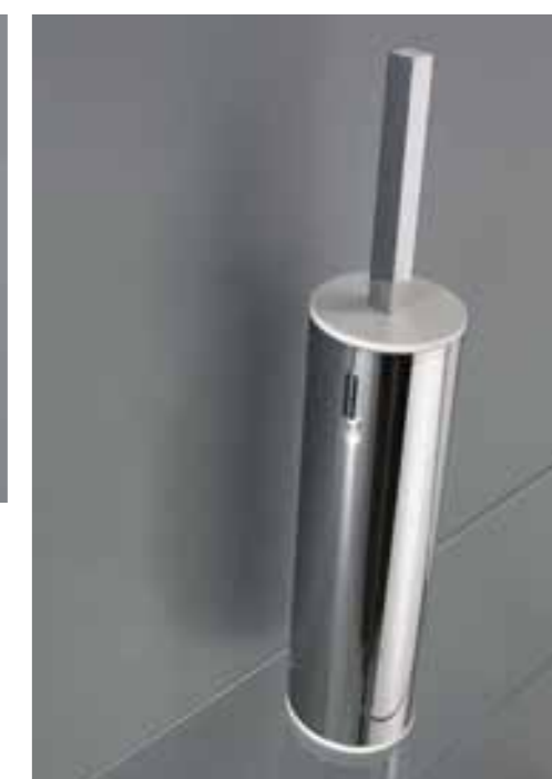
scopino Art. 8325