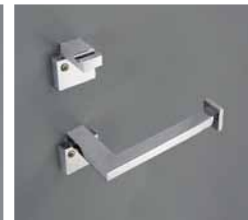
appendino Art. 8326 portarotolo Art. 8324