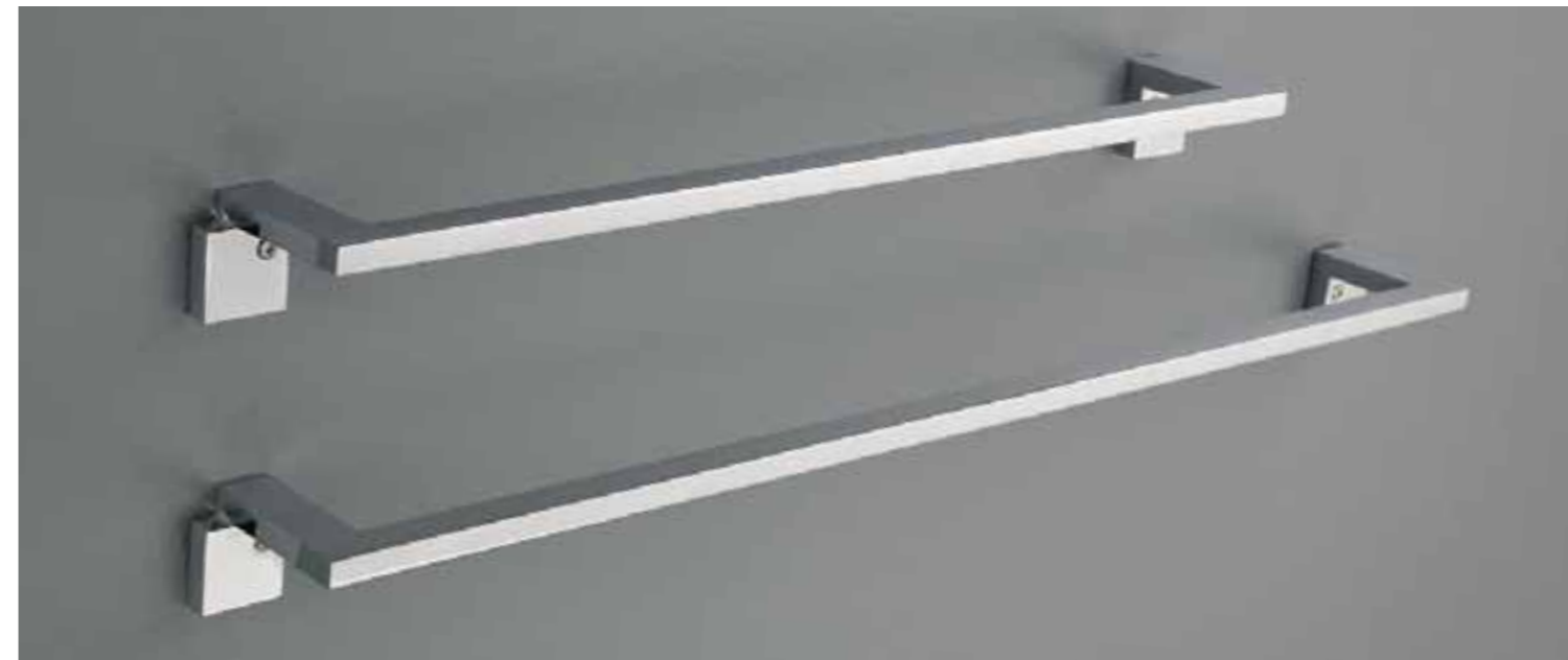
portasalviette L 60 cm Art. 8323 portasalviette L 45 cm Art. 8322