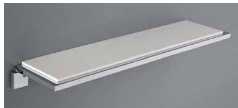
mensola L 45 cm Art. 8327