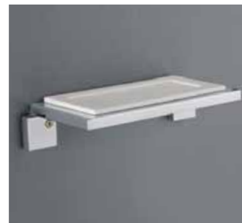
portasapone Art. 8320